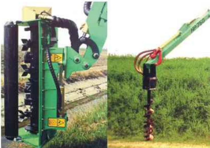
Mähkopf 180° hydraulisch schwenkbar