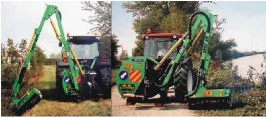
180° Schwenkbereich - Arbeitseinsatz links oder rechts vom Schlepper