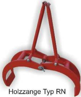
Holzzange Typ RN