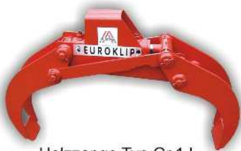
Holzzange Typ Gr.1 L