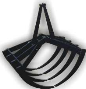
Dunggabel mit 8 Zinken oder 12 Zinken