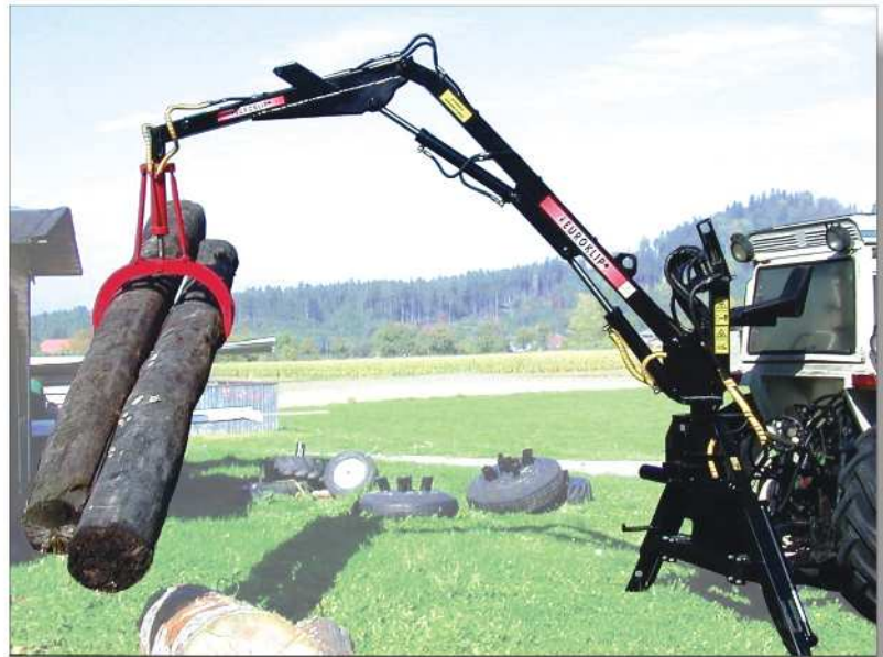
Der EUROKLIP Kombilader kann kräftig zupacken