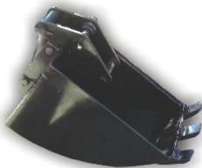
Tiefloeffel 30 cm